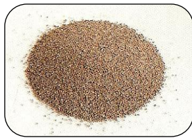
1 mm (1 mm以下)