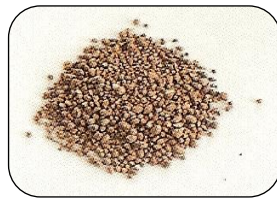
3 mm (1 ~ 3 mm)