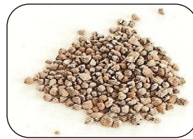
5 mm (3 ~ 5 mm)